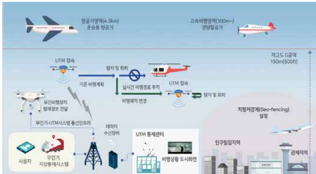
<그림 1> 무인 이동체 교통관리체계 개념도

드론 활용이 기술발전과 더불어 진행되자 하늘의 교통량 증가로 인해 충돌위험성도 같이 증가되는 새로운 우려가 발생하였으며, 이에 대한 보완에 대한 우려와 한정된 하늘을 유효하게 사용한다는 측면에서 드론의 교통관리와 운항관리가 필요하게 되었다. 이런 상황에 대해 미국을 중심으로 2010년대에 UTM에 대한 논의와 연구가 급격히 활발해졌다. UTM(UAV Traffic Management)은 무인항공기 교통관리를 의미하며 드론 기술의 발전에 따라 민수와 공공분야의 활용이 증대되고 비행 수요가 급격히 증가함에 따라 항공교통의 효율성과 안전성을 제고하기 위한 새로운 제도과 기술 개발이 점차 요구되는 시점에 등장했다. <그림 1>은 국토교통부에서 제작한 무인이동체 교통관리 체계(UTM) 개념도이다.